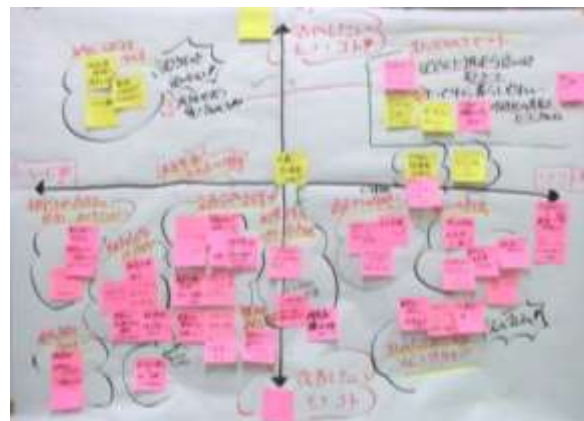
▲参加者からのご意見