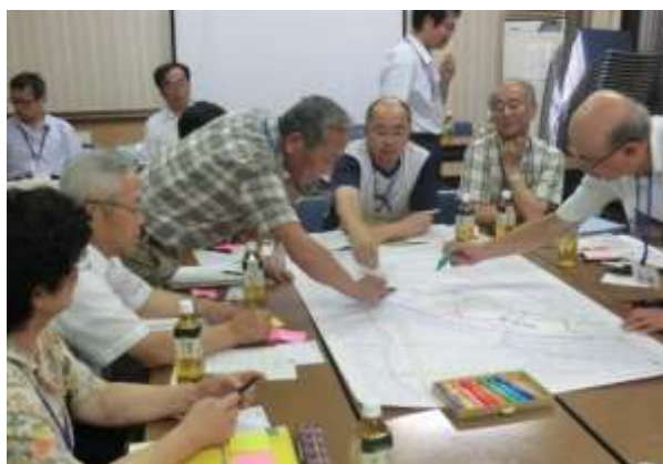
▲ワークショップの様子