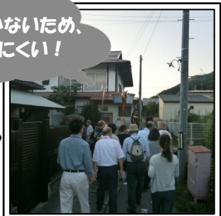
⑧大納言通りと路地