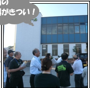
④辰野駅と駅前広場