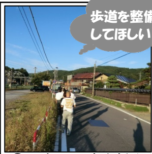
⑤駅東から清水橋を 結ぶ主要な町道