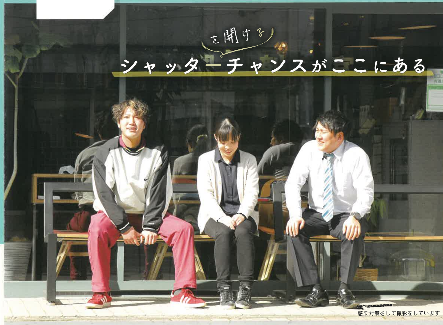
感染対策をして撮影をしています

JR辰野駅から続く商店街はいつの間にかシャッターが閉じたままの姿に…。しかし、ここ数年でそのシャッターが再び開き始めているのをご存知ですか。