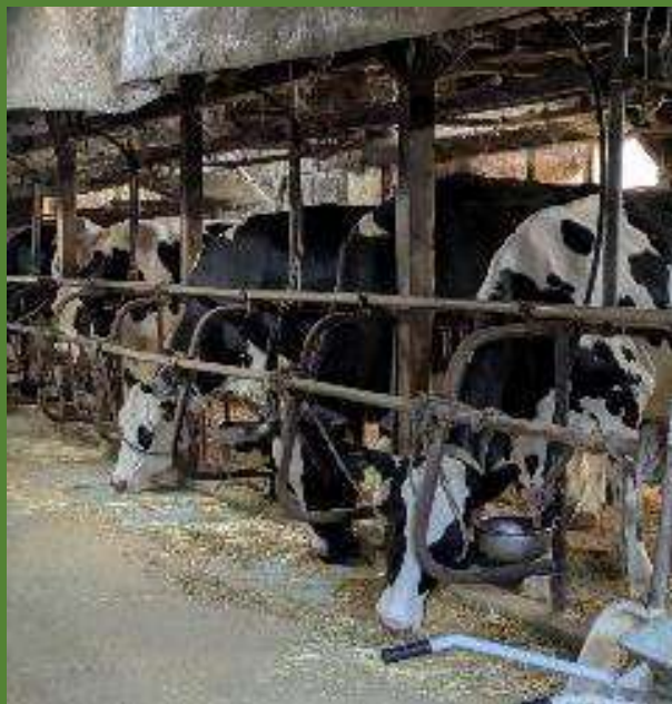
(株)フォーレスト主催 土づくり勉強会 (松川町～宮田村)

採種現場のご案内や、採種方法のご紹介も行わせていただきました。また、うえると(株)とお繋ぎして、種や苗の購入の他、採種の委託・買取の輪も少しずつ広がっています。