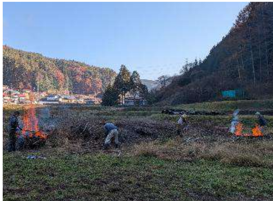
夏に伐採した竹を竹炭にする作業 (辰野町沢底)

2025年5月10日より、町で有機農業に興味のある皆さんが集まり、作業や情報交換を行う「有機塾」という会に参加させていただいています。