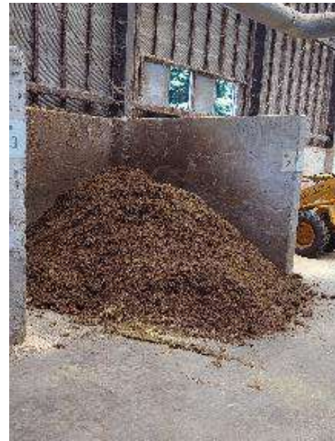
土づくりセンター 視察(辰野町小野)