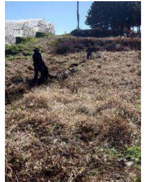
大豆収穫作業お手伝い (茅野市)