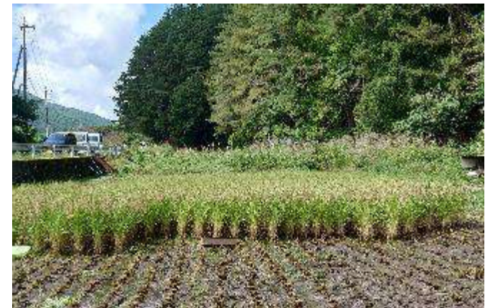
田植え・稲刈りお手伝い (辰野町小野、川島)