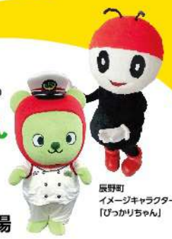
辰野町 イメージキャラクター 「ぴっかりちゃん」