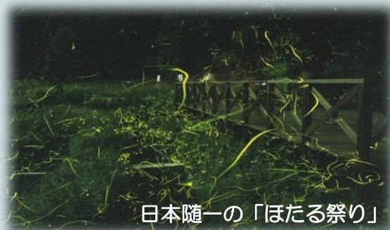
日本随一の「ほたる祭り」