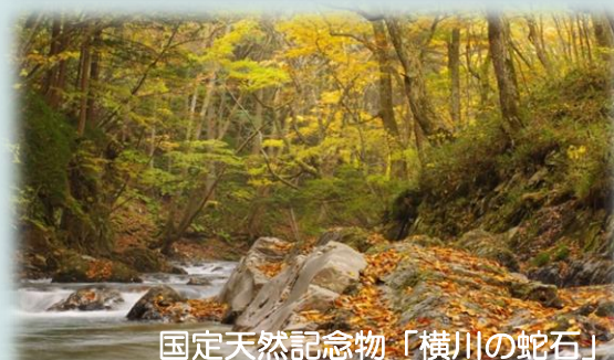
国定天然記念物「横川の蛇石」