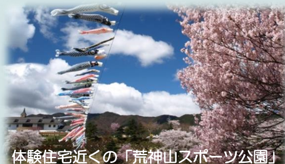
体験住宅近くの「荒神山スポーツ公園」