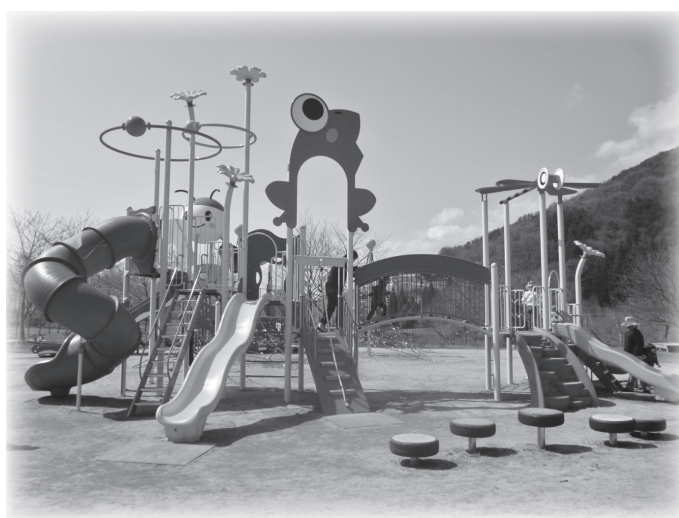
辰野ほたる童謡公園