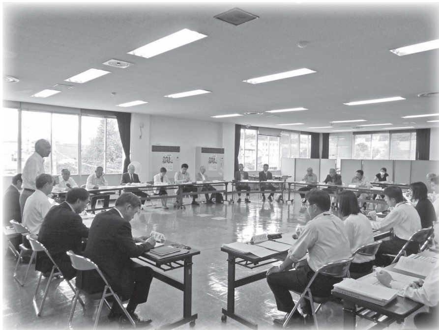
行財政改革推進委員会

※次ページ以降の主要施策内の《 》は第六次行財政改革大綱推進プログラムの行革コードに該当します。